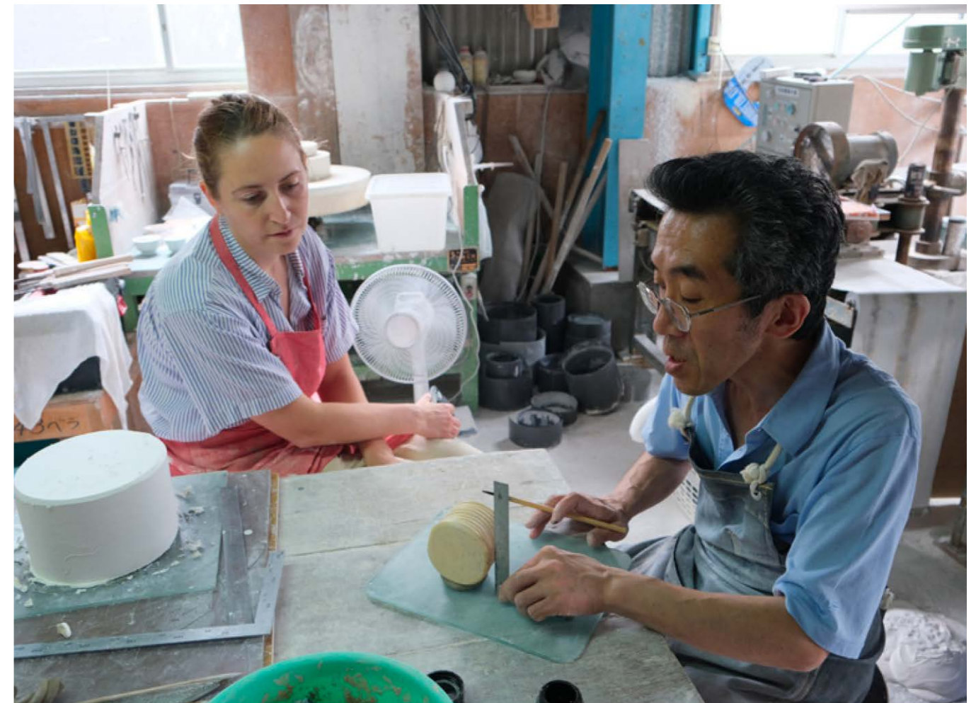
Simone Post tijdens residency in Arita