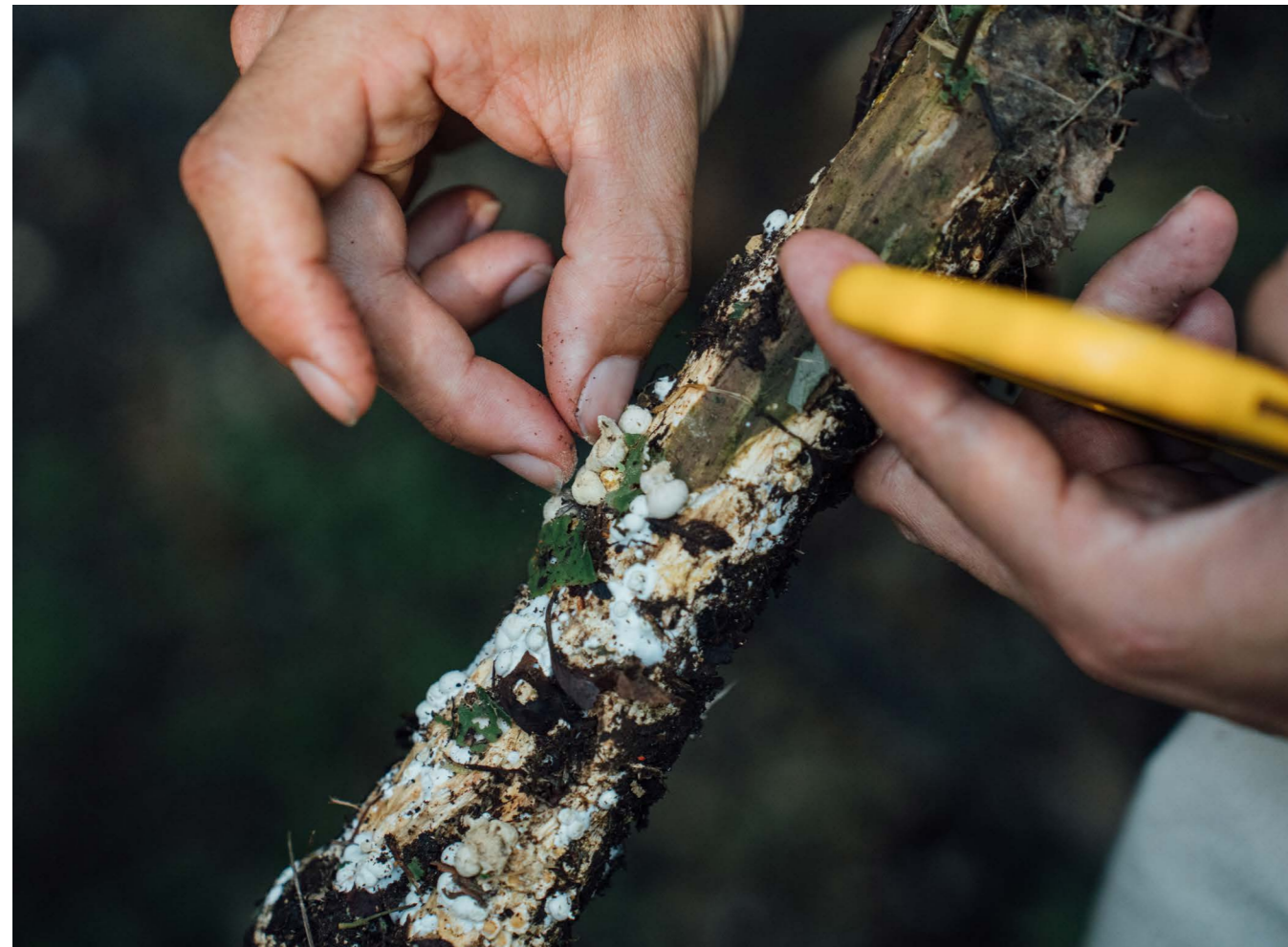
Let's Become Fungal workshop in Taipei, door Yasmine Ostendorf