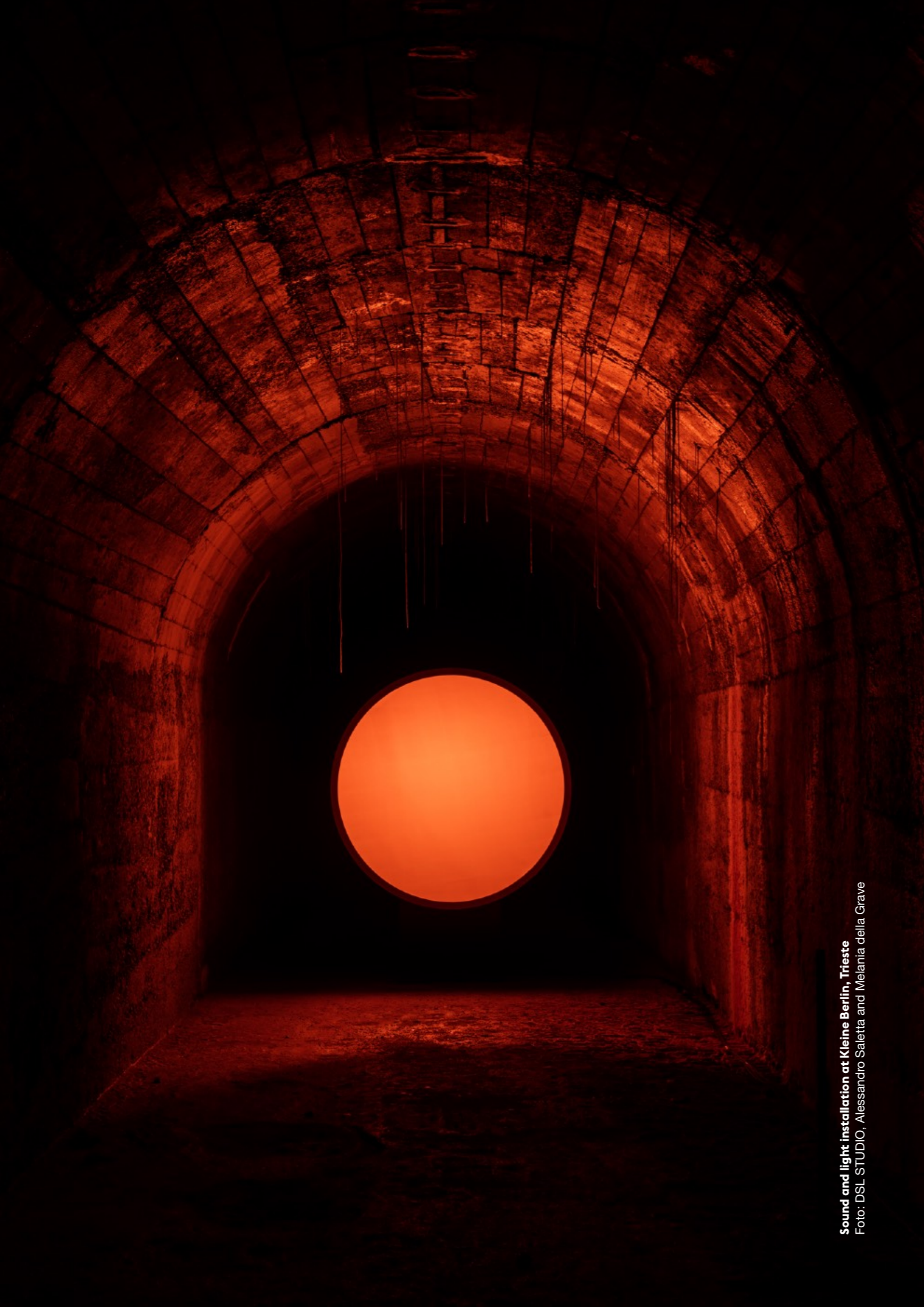
Sound and light installation at Kleine Berlin, Trieste