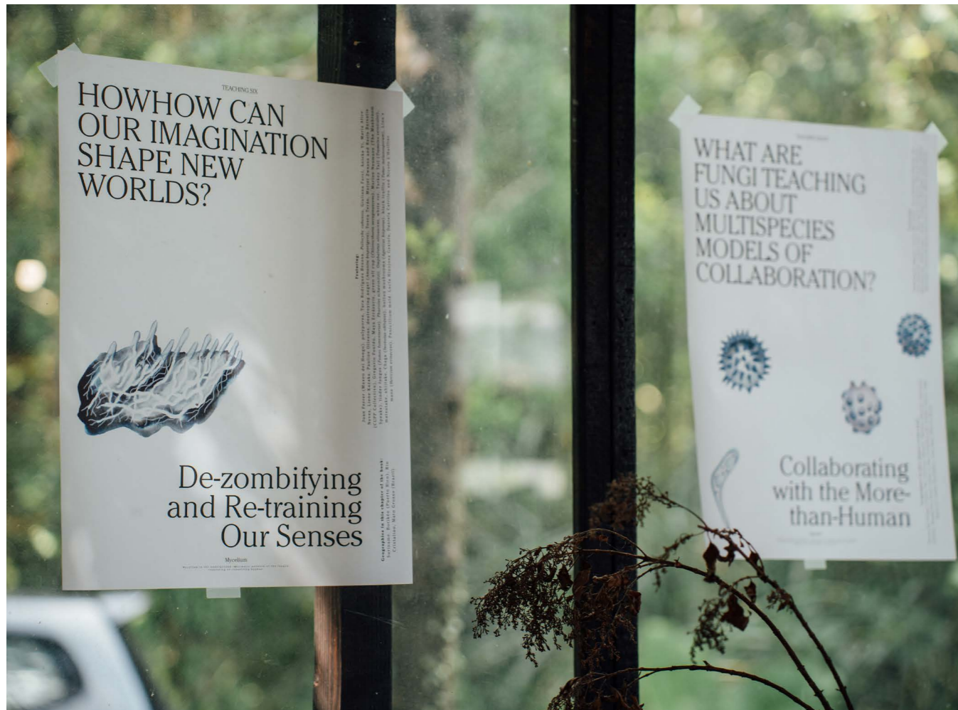
Posters van Let's Become Fungal, Taipei, door Yasmine Ostendorf