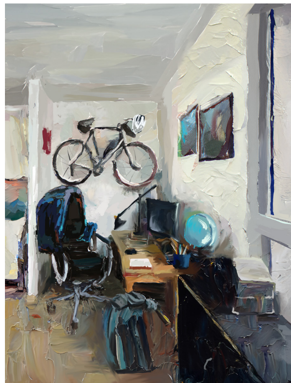
De Rechtvaardige Plattegrond

In hun ontwerp onderzoek namen de architecten de huidige nieuwbouwstandaarden kritisch onder de loep en onderzochten ze aan welke criteria een rechtvaardige woning zou moeten voldoen. 'Rechtvaardigheid in woningbouw gaat niet over voldoen