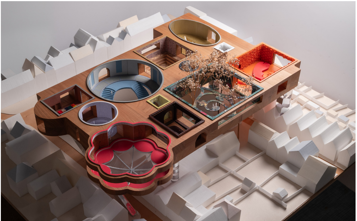
Podiumruimte, foto: Jingwen Gan

Een belangrijk eindresultaat van het project is een grote maquette: een fictief Nederlands dorp op schaal, met daarboven een