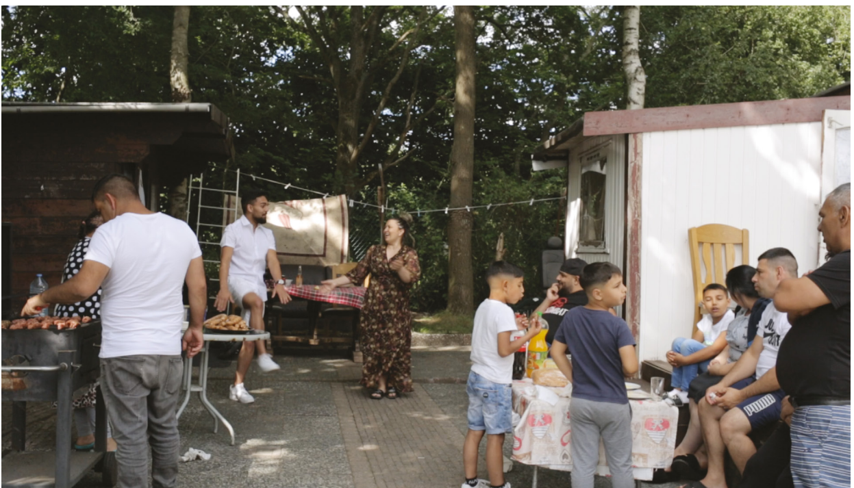
Housing for Migrant Workers

Door op het vakantiepark hun eigen plek te bouwen hebben de families zich geëmancipeerd uit het onrechtvaardige huisvestingsstelsel voor arbeidsmigranten. In plaats van via de werkgever een ondermaatse woning te huren hebben zij hun eigen woongemeenschap opgezet. Met gratis verkregen materialen pasten ze de kleine vakantiehuizen aan naar hun wensen en zorgden ze voor meer leefruimte. 'Onze rol was om te begrijpen en te reconstrueren wat zij hadden gedaan', vertelt Renzo. In de documentaire Reimagining Migrant Workers , laat een van