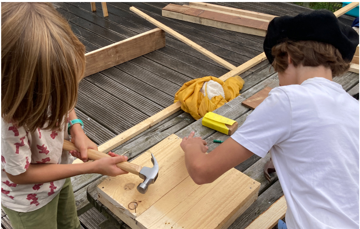
De Andere Bouwplaats