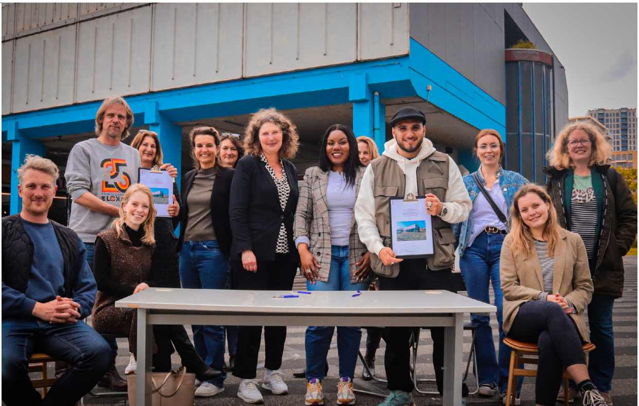
School voor Strijders

'Er komen zoveel misstanden samen in dit onderwerp en hoe dat tot uiting komt in ruimtelijk ontwerp: het recht op huisvesting,